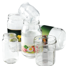
Les pots et bocaux en verre